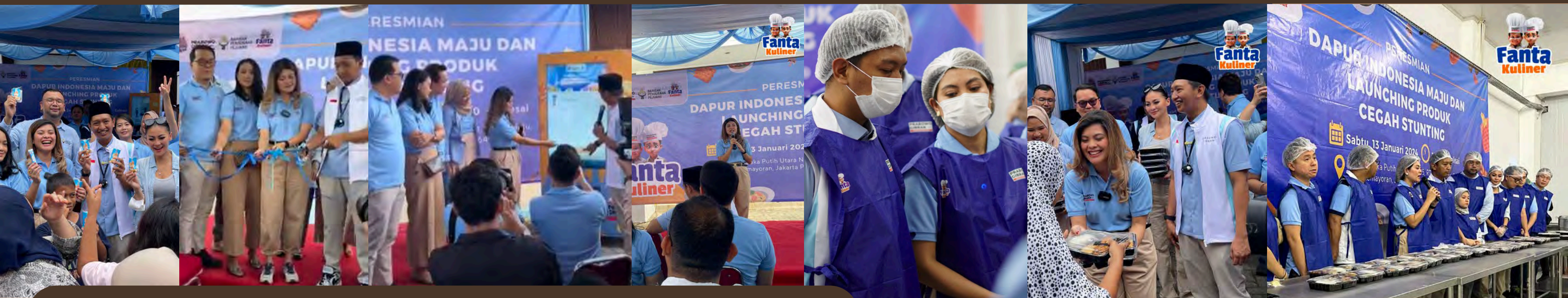
Dapur Indonesia Maju dan Launching Produk Cegah Stunting

Tim Kolaborasi Nasional Bidang Kuliner ini adalah komunitas yang dibentuk untuk mendukung pemilihan presiden Indonesia, dengan pasangan calon Prabowo-Gibran. Tim ini berfokus pada sektor kuliner, menggerakkan para pelaku usaha dan profesional di industri makanan dan minuman untuk berkolaborasi, berbagi ide, serta memberikan dukungan strategis dalam kampanye. Melalui berbagai kegiatan dan program, tim ini berupaya meningkatkan partisipasi dan keterlibatan komunitas kuliner dalam mendukung visi dan misi pasangan calon.