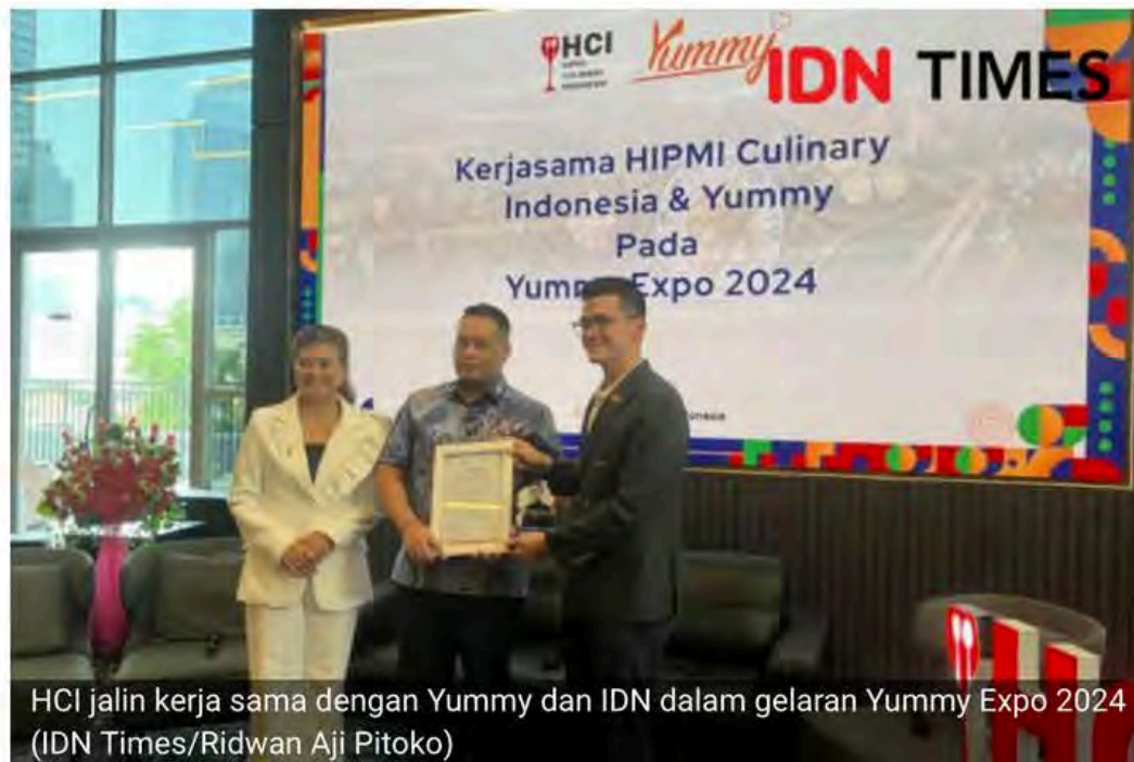
HCI jalin kerja sama dengan Yummy dan IDN dalam gelaran Yummy Expo 2024

Hipmi Culinary Indonesia jalin kerja sama dengan Yummy IDN